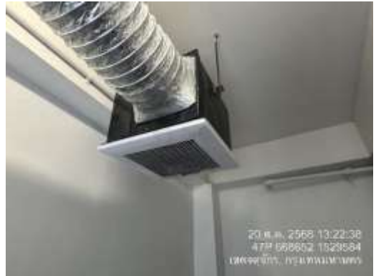
รูปที่ 17 พัดลมดูดอากาศ