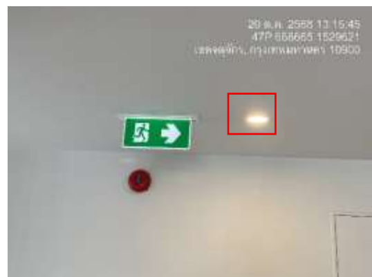
รูปที่ 20 ไฟส่องสว่าง