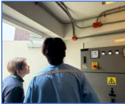
รูปที่ 34 เจ้าหน้าที่ตรวจสอบอาคาร