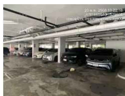
รูปที่ 5 พื้นที่จอดรถ