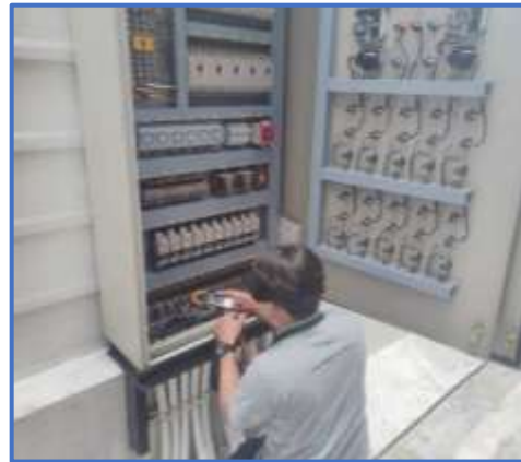
รูปที่ 35 เจ้าหน้าที่ดูแลระบบบำบัดน้ำเสีย