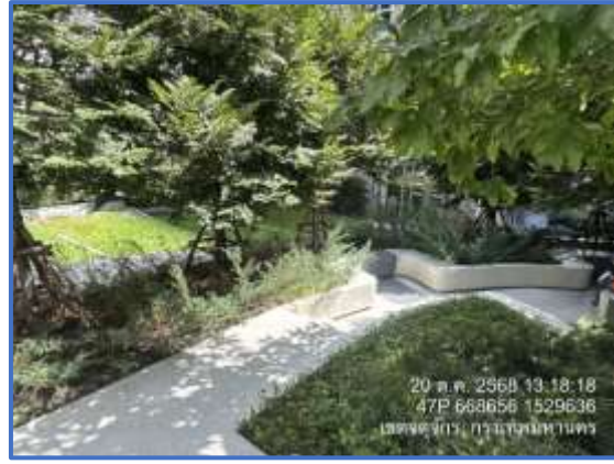
รูปที่ 2(ต่อ) พื้นที่สีเขียวและต้นไม้รอบโครงการ