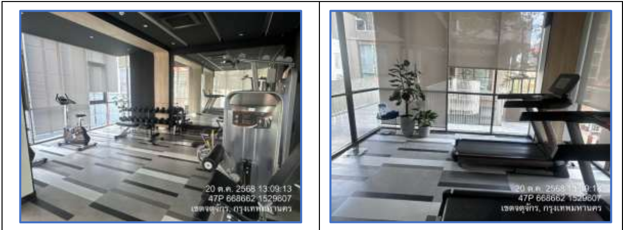
รูปที่ 30 ห้องออกกำลังกาย