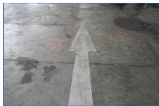
รูปที่ 6 สัญลักษณ์จราจร