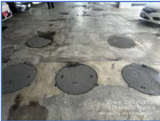
รูปที่ 3 ระบบบำบัดน้ำเสีย