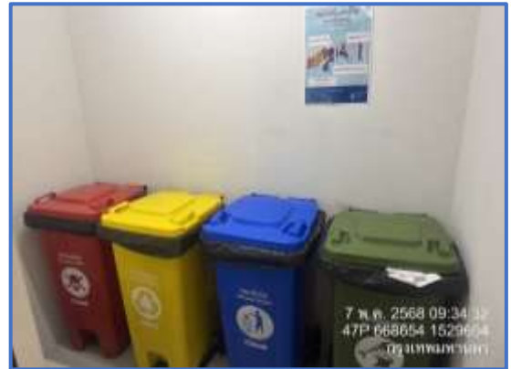
รูปที่ 37 (ต่อ) เจ้าหน้าที่ดูแลรักษาความสะอาดห้องขยะ