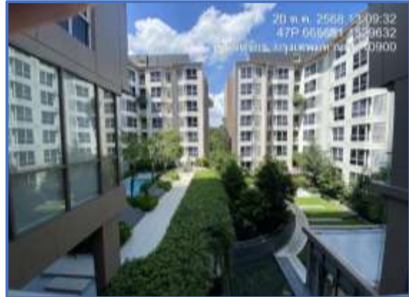
รูปที่ 2 พื้นที่สีเขียวและต้นไม้รอบโครงการ