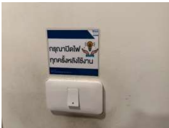
รูปที่ 19 ป้ายรณรงค์ปิดไฟเมื่อไม่ใช้งาน