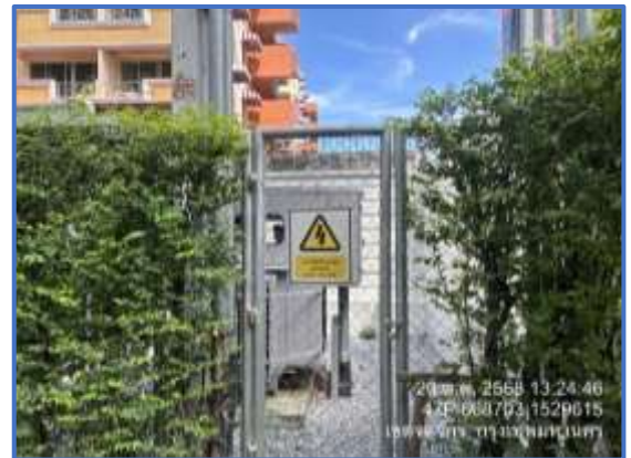
รูปที่ 18 หม้อแปลงไฟฟ้า