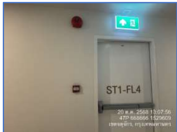
รูปที่ 29 ป้ายเส้นทางหนีไฟ