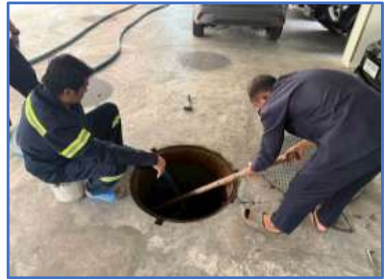
รูปที่ 41 เจ้าหน้าที่สูบล้างไขมันออกจากระบบ บำบัดน้ำเสีย