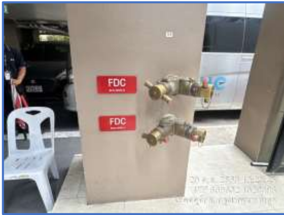
รูปที่ 25 หัวรับน้ำดับเพลิง