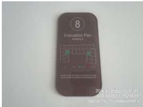
รูปที่ 27 แผนผังทางหนีไฟ