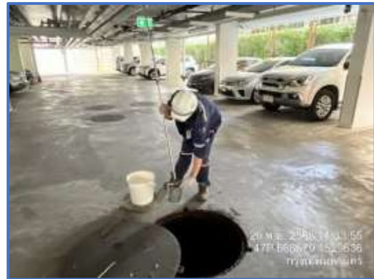
รูปที่ 4 เจ้าหน้าที่ตรวจสอบคุณภาพน้ำทิ้ง