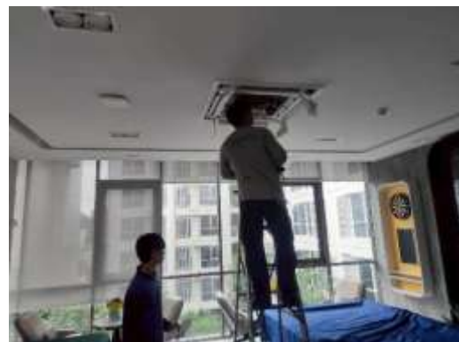
รูปที่ 40 เจ้าหน้าที่ตรวจสอบช่องระบายอากาศ