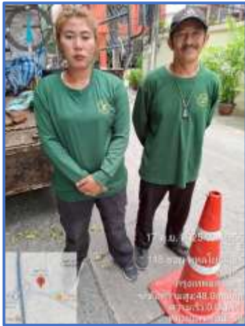
รูปที่ 1 เจ้าหน้าที่ดูแลภูมิทัศน์ภายในโครงการ