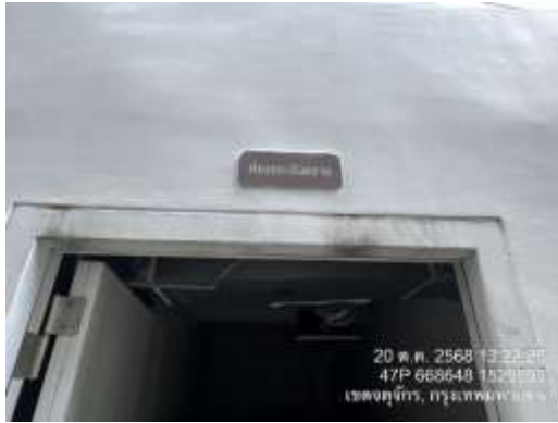
รูปที่ 16 ห้องพักขยะมูลฝอยอันตราย