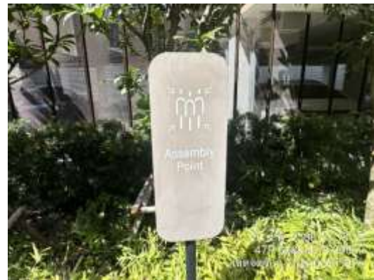
รูปที่ 28 จุดรวมพล