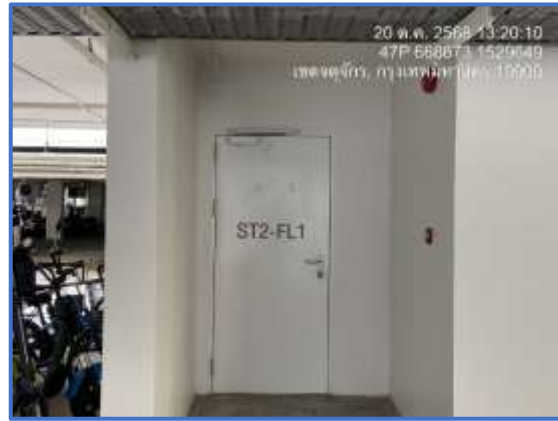
รูปที่ 26 ประตูหนีไฟ