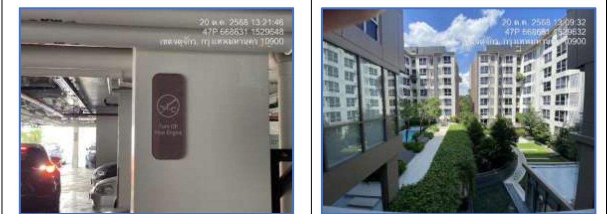
รูปที่ 31 บ้ายดับเครื่องยนต์